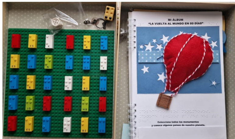
Figura 6. Caja con álbum de pegatinas y actividades de ocio inclusivas

La portada del álbum está «ilustrada» con un globo aerostático en alto relieve, de fieltro, que se desplaza por la página, dejando atrás un cielo estrellado, cuyas estrellas troqueladas son perceptibles al tacto.