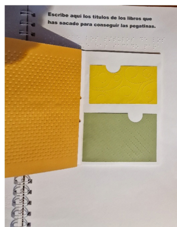
Figura 7. Páginas interiores del álbum para indicar la relación de libros leídos

Las fichas que se deben rellenar sobre la información requerida de cada libro se presentan en un tamaño poco frecuente, con pestañas de distintos colores y for-