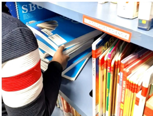
Figura 5. Biblioteca de aula con títulos en braille y en tinta