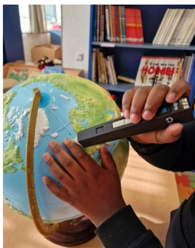
Figura 2. Globo terráqueo con etiquetas audibles con lápiz lector