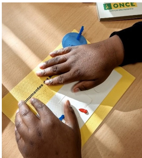
Figura 8. Cuaderno Monumentos del mundo

El interior muestra, en cada página, una representación bidimensional en relieve de cada uno de los monumentos previamente trabajados en la maqueta. Las imágenes representadas han sido atentamente elegidas resaltando rasgos críticos que las definan y desechando aquellos detalles visuales que interfieren su identificación