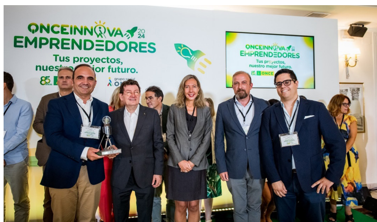
Figura 2. Empresa ganadora Led5V

El jurado de esta edición, compuesto por expertos de empresas tecnológicas como Microsoft, Google y AWS, así como organizaciones líderes de impacto como Ashoka y la Fundación ONCE, y referentes del Grupo Social ONCE, evaluaron más de 80 propuestas de start-ups , scale-ups y emprendedores a lo largo de todo el proceso hasta llegar a las propuestas ganadoras.