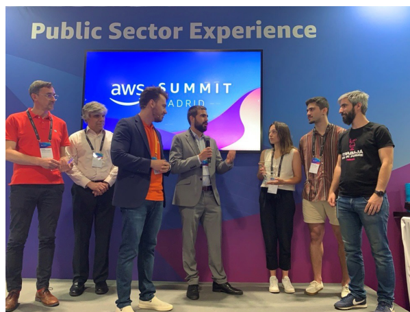
Figura 4. Hackathon for Good aws

A través de la generación de alianzas estratégicas, la ONCE desarrolla programas, retos, hackathons y sesiones divulgativas en las que generamos oportunidades de negocio y desarrollo de soluciones en torno a la innovación inclusiva. Ejemplo de ello es la participación de ONCE Innova en los Tech Lab e Impact Projects de la IE University, en los que los estudiantes de máster plantean soluciones tecnológicas en ámbitos de interés para la organización. O en el Hackathon for Good de AWS (Amazon