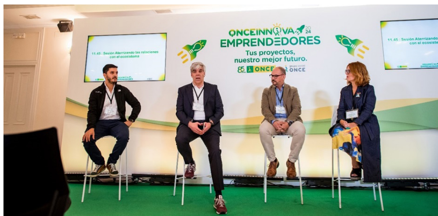
Figura 1. Bootcamp de innovación inclusiva reto ONCE Innova Emprendedores 2024

El reto culminó en una sesión final ( demo day ) el día 24 de septiembre, en la que las start-ups finalistas disfrutaron de sesiones sobre innovación inclusiva de la mano de referentes del Grupo Social ONCE y empresas del jurado, y presentaron sus propuestas de piloto para que el jurado determinase las ganadoras (una por cada categoría). Esta edición, Yasyt 5 y Led5V 6 fueron proclamadas ganadoras en las categorías de mejora de la calidad de vida de las personas con ceguera y deficiencia visual y de enriquecimiento y transformación del puesto de trabajo en la ONCE, respectivamente. Yasyt ofrece soluciones tecnológicas