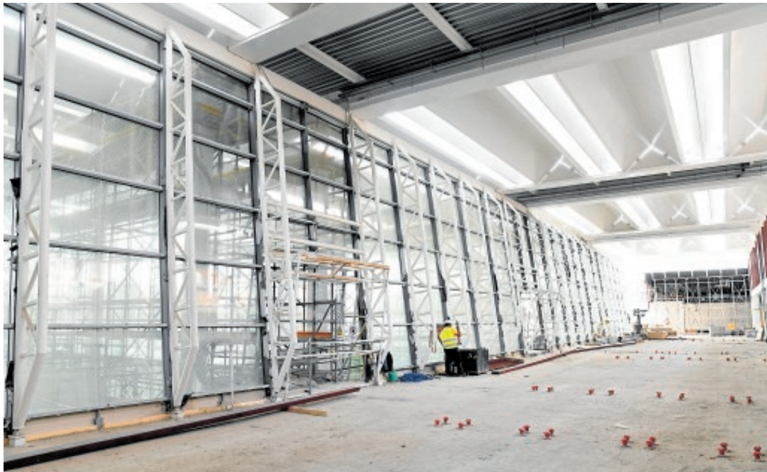
Trabajos en el vestíbulo de la estación de Chamartín-Clara Campoamor, este mes de julio