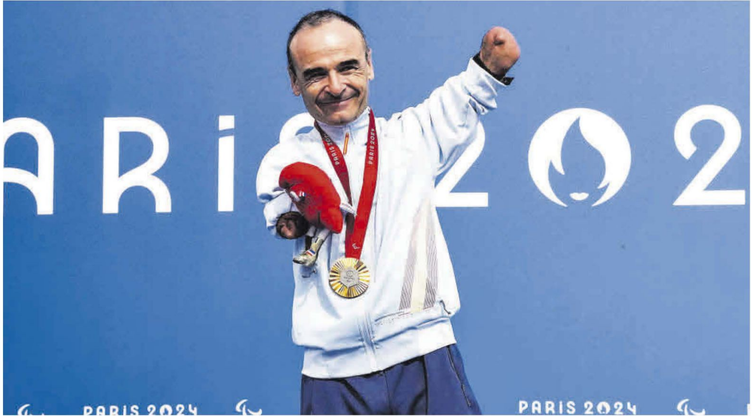
El valenciano Ricardo Ten, tras recibir la medalla de oro en la contrarreloj en ruta C1, en los Juegos Paralímpicos de París 2024.