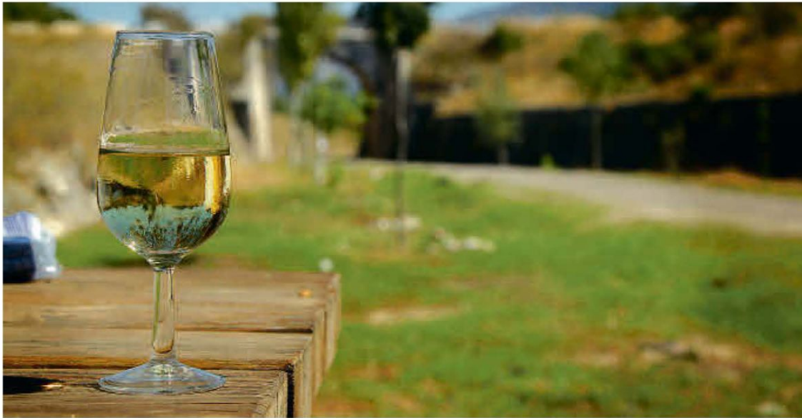
Camino Natural Vía Verde del Aceite